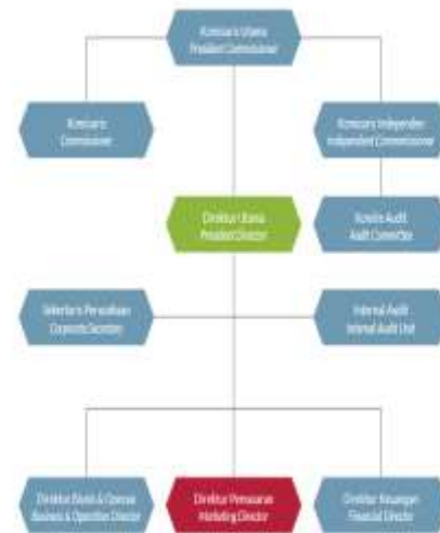
Gambar Struktur Organisasi PT.Modern Internasional Tbk